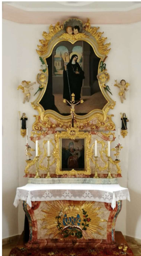
Kapelle Spielhof, Hl. Walburga